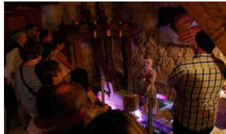
Asistentes a uno de los pases de "Sensatio".

La compañía zamorana dará a conocer la producción de "Las maravillosas aventuras de Ulises" en el marco "de un espacio habilitado para los programadores, fuera de la selección oficial de la feria", atestigua Cándido de Castro, quien explicará los detalles de esta obra que versa sobre "la odisea de vida a través de un viaje por los lugares que visitó Ulises a lo largo del Mediterráneo" y donde la narración se funde con momentos poéticos, grotescos, cómicos y dramáticos.