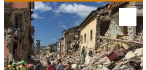
Amatrice, el "fin del mundo"